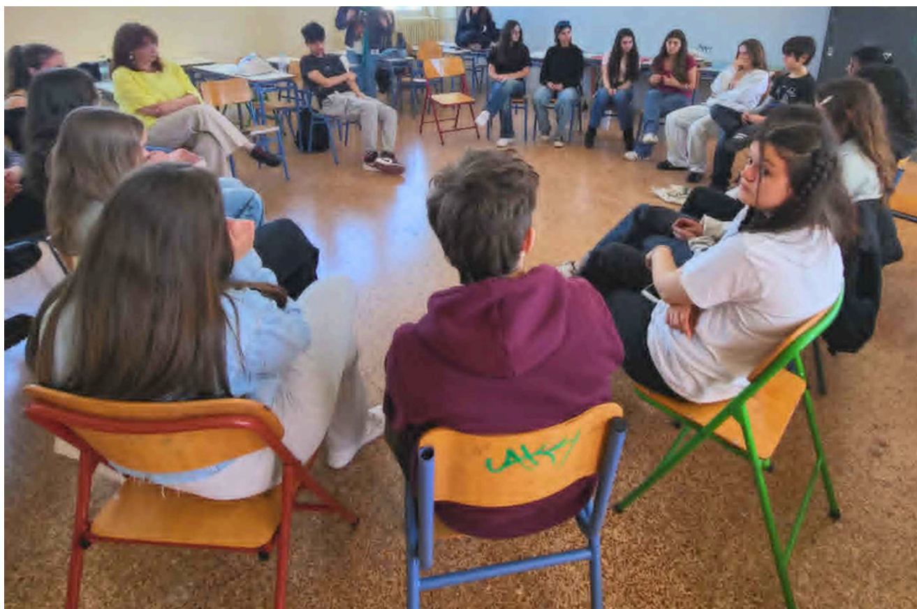
Μια από τις 4 υποομάδες της Ημέρας Διαλόγου, σε διάταξη κύκλου