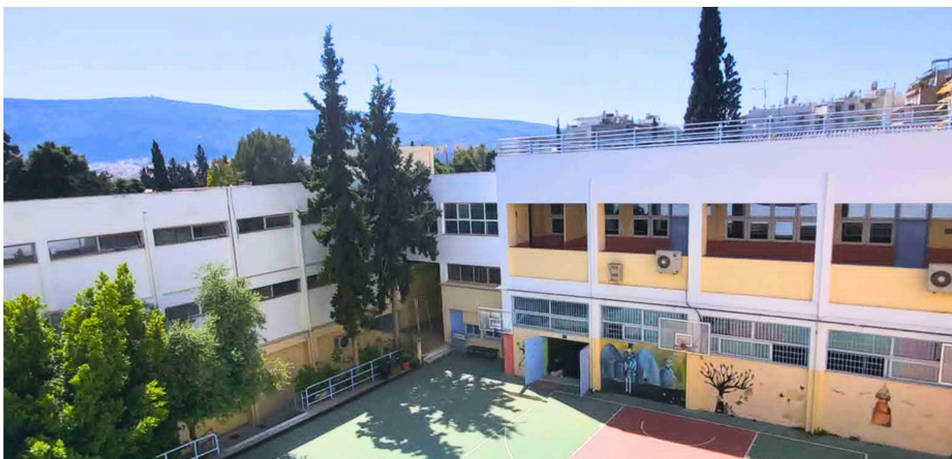
Το Πρότυπο ΓΕΛ Αθήνας / Αμπελοκήπων που φιλοξένησε την Ημέρα Διαλόγου

Η μεθοδολογία της συνάντησης αυτής προτείνεται από την Πρωτοβουλία CAMHI, που είχε την ευθύνη της συνάντησης, ως εργαλείο που μπορεί να αξιοποιηθεί και εφαρμοστεί στα σχολεία για να δώσει χώρο έκφρασης και ανταλλαγής απόψεων για διάφορα θέματα που μπορεί να απασχολούν τις σχολικές κοινότητες.